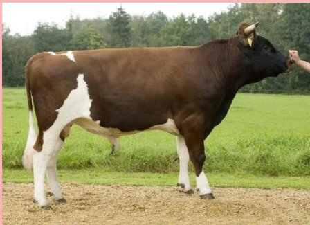
Epke fan'e Slinke: Topper in NVI en melk en INET