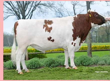
Rivelino 712: Goede melktypische stier uit Kate 833 met hoge gehalten