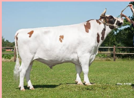
Rivelino 533: Topper uit de stal Endendijk: Veel melk! Een aAa 135