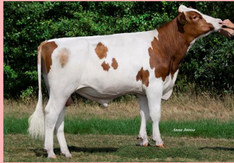
Bernard 30: Mooie melktypische stier, outcross Fries Roodb, ook pinkenstier