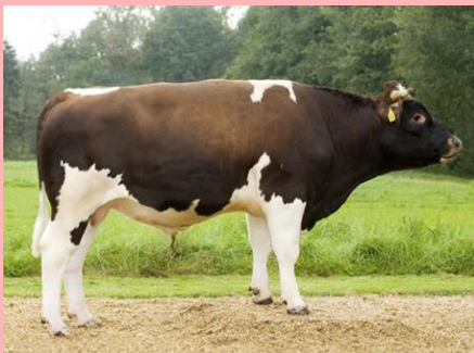
Jetse Goasse: een mooie donkerrode pinkenstier, gemakkelijk afkalven