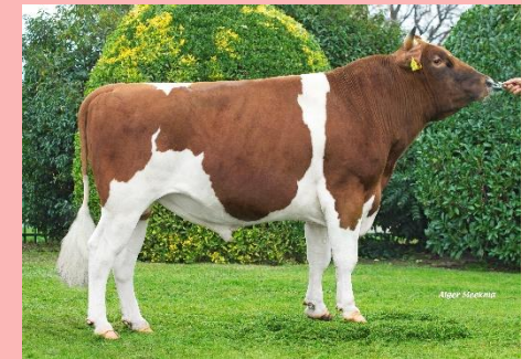
Jelle 3 Uit een moeder met hoge gehalten