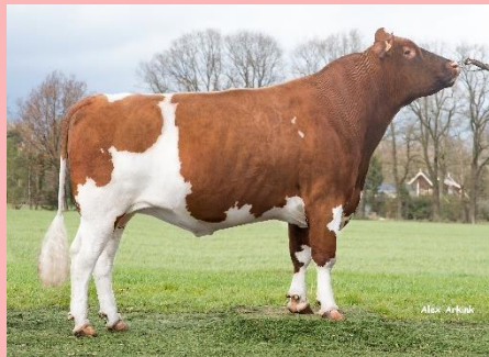
Folker 5592: Grote stier uit Frankrijk: Lijnfokkerij sinds 1988!