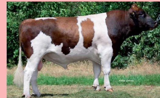
Bio Skúster Melis: royale dubbeldoel stier uit melkrijke moederlijn. Grote stier