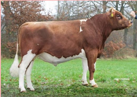
Surfenne Frank: Een aanwinst voor de populatie, unieke TRIPLE a code