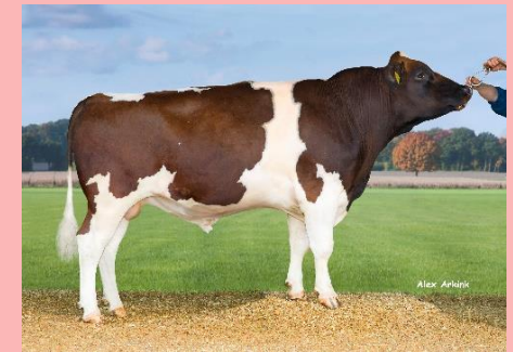
Elke: Een aanrader! Een gehaltenstier