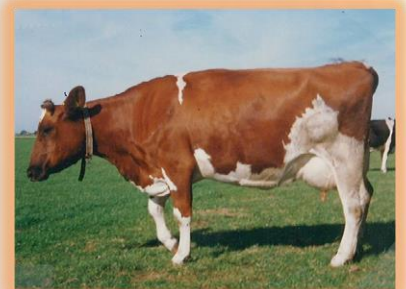
Hibma 60, moeder van Wybren

Wie een liefhebber is van de Reitsma fokkerij: Dit is dé stier: Brengt de Hibma's en de Feikje's samen en is ingeteeld op Agricola Wim. Een stier met een 'noflik' karakter. Vader is Surfenne Feike (Jet Teade x Surfenne Auke x Agricola Wim). Moeder is de bekende Hibma 60 (Surfenne Fiat x Agricola Wim) Een koe met goede gehalten. (4,86-3,45 / 4,99-3,49 en 4,91-3,44). (Meer info op onze website).